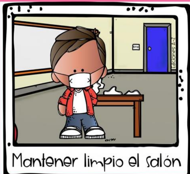
Mantener limpio el salón