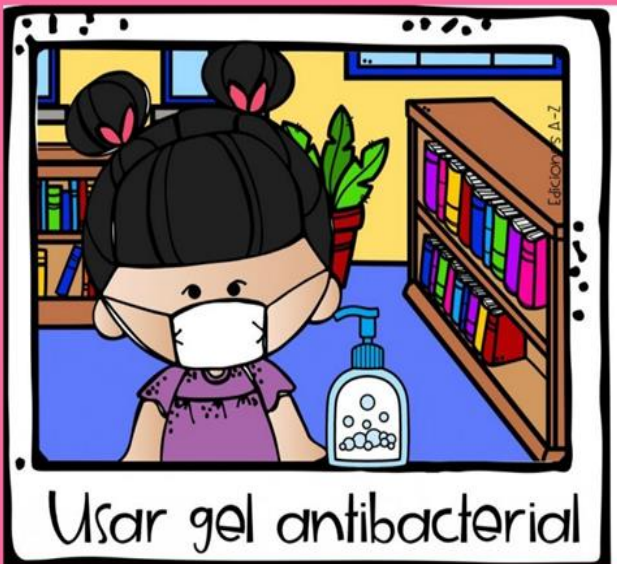
Usar gel antibacterianal